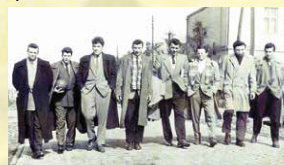
Odbojkaški klub „Borovo“