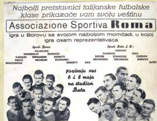
Gostovanje AS Rome u Borovu

Načiniti izbor najboljih i najznačajnijih među mnogobrojnim obiteljima koje su stvarale „Borovo“, između 22 tisuće zaposlenika, između tisuća sportskih i kulturnih radnika zaista je nemoguće.