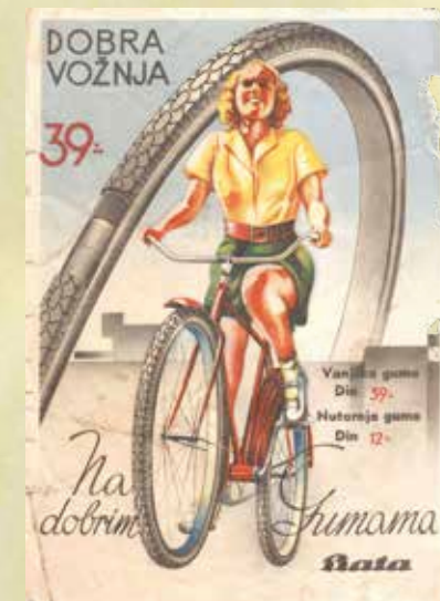
Reklamni plakat Bata

Prvih godina „Bata“ još nije imao dovoljno sportskih objekata, ali gradeći ih iznimno brzo, kao i tvornicu i naselje, riješio je to pitanje. U početku radnici igraju nogomet na tzv. Temzi, igralištu pokraj pruge, između Centralnog skladišta i direktorske vile. Već 1932. godine, za zimskih dana, puno se igra stolni tenis i šah u tadašnjem prvom Društvenom domu, koji se nalazio na mjestu gdje je poslije izgrađena tvornica strojeva. Stadion je izgrađen 1933. godine, a osnovna škola s modernom gimnastičkom dvoranom 1935. Za samo tri do četiri godine ljubitelji športa u Borovu Naselju stekli su uvjete za bavljenje različitim sportovima: nogometom, odbojkom, hazenom (tada vrlo popularnom), boksom, gimnastikom, tenisom i stolnim tenisom, biciklizmom.