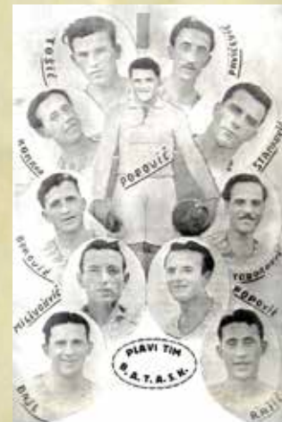
B.A.T.A.S.K. Plavi tim