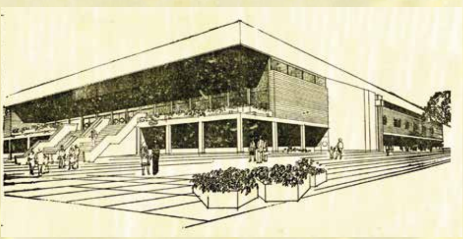
Za izložbu je korištena građa

Gradske knjižnice Vukovar Gradskog muzeja Vukovar