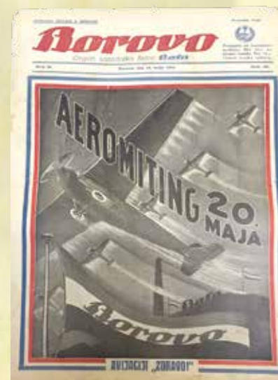
Naslovnica novina Borovo, 1934.