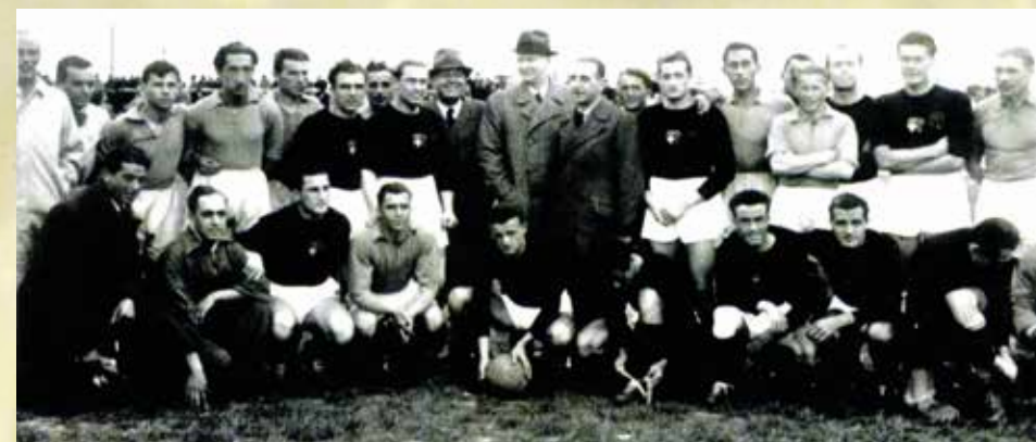
Bata - Ambrozijana (Milano), 1938.